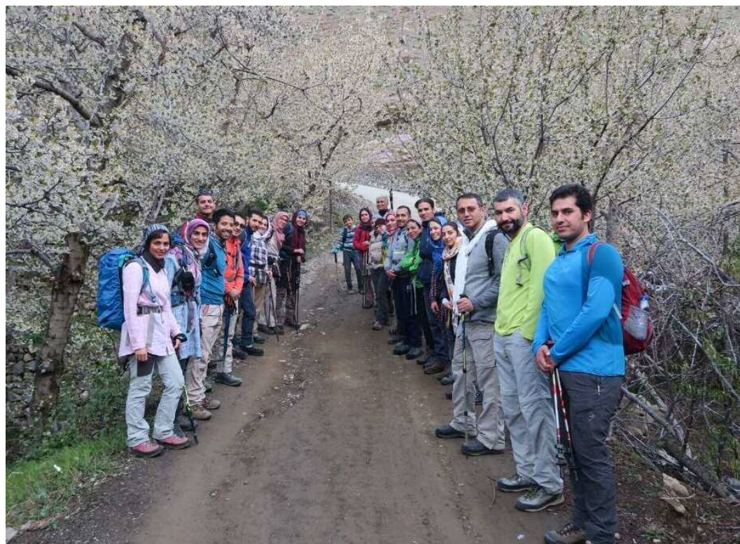
عکس های برنامه: