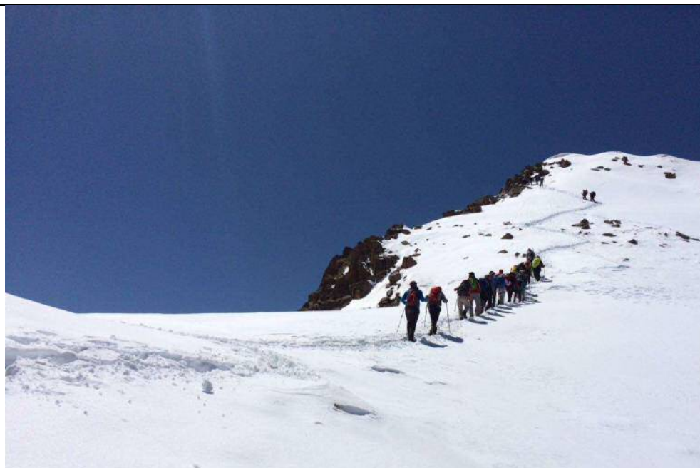
در مسیر قله