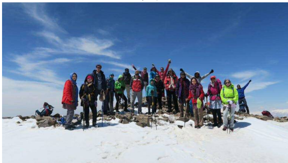
تیم بر فراز قله