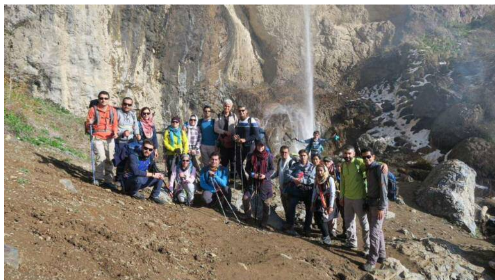
کنار ایشار سنگان